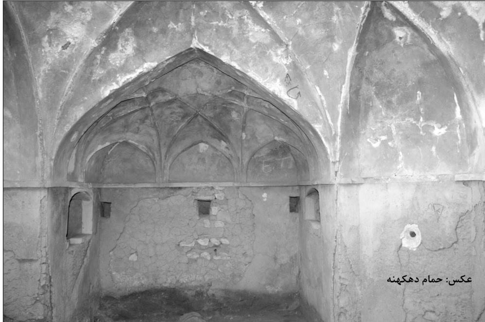
عکس: حمام دهکهنه

شده است و می توان گفت ما شاهد اولین دهکده هایی هستیم که در دشت لامرد و علامرودشت ایجاد شده. اولین روستاهایی که در ۷ هزار سال پیش در کنار رودخانه ها و شاخاب هایی که از کوهستان های مجاور سرچشمه گرفته، به وجود آمده و به گونه ای اولین فرهنگ های روستائینی و زندگی در دشت شاهد هستیم که به لحاظ باستان شناسی یک کشف مهمی برای شهرستان لامرد است. و در بعضی از محوطه ها توالی استقراری داریم که نشان از پیوستگی و استمرار سکونت در این دو دشت است.