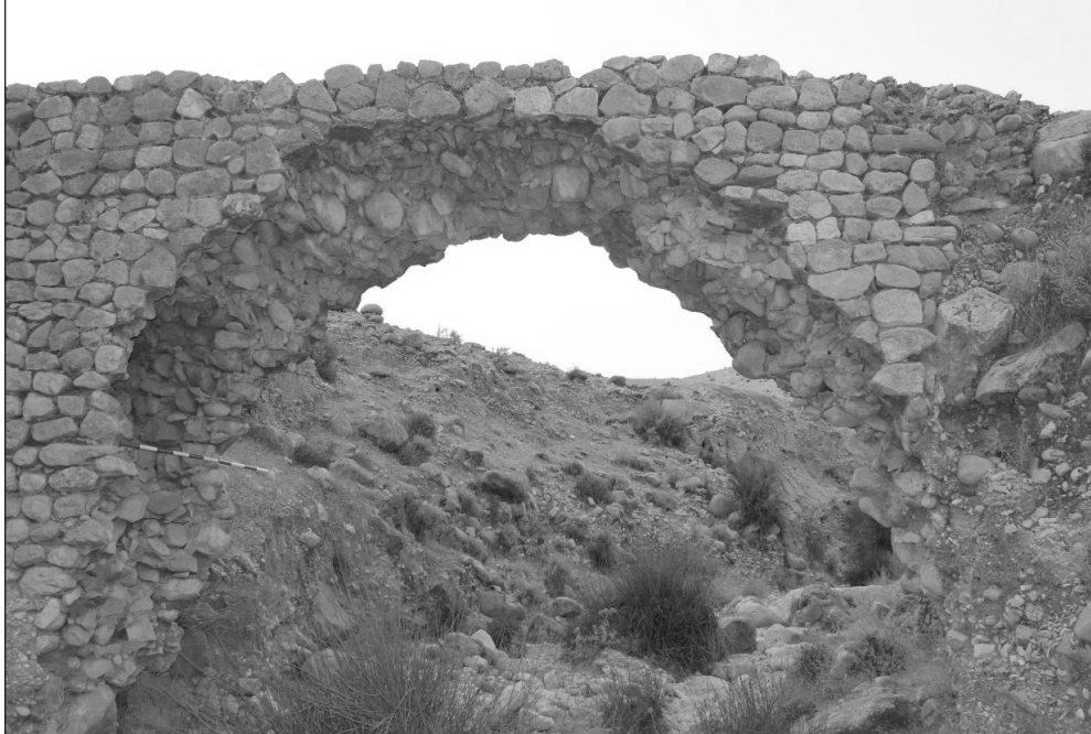
عکس: پل آب بر تنگ اوماری

رودخانه مهران تنها رودخانه فصلی که در وسط دشت قرار دارد از ارتفاعات شهرستان مهر (بخش اسیر) سرچشمه گرفته و در انتها به خلیج فارس می ریزد.