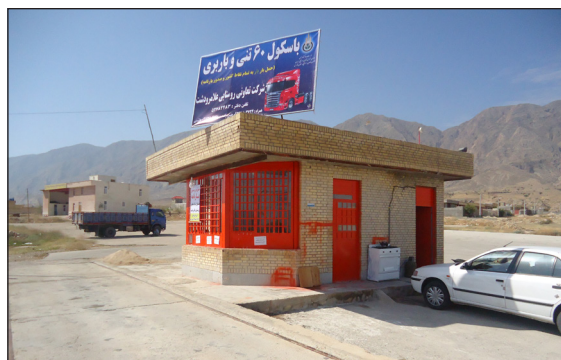
عملکرد آماری شبکه تعاون روستایی لامرد

انتخاب شایسته حضرتعالی به عنوان نماینده بازاریان استان فارس در اتاق اصناف ایران مایه مسرت و شادمانی است، این نشریه ضمن عرض تبریک برای این مسئولیت جدید، از درگاه ایزد متعال برایتان بهروزی و توفیق مداوم قدمت به بازاریان و کسبه عزیزمان را آرزومندیم. /هیات تحریریه نشریه افق فارس